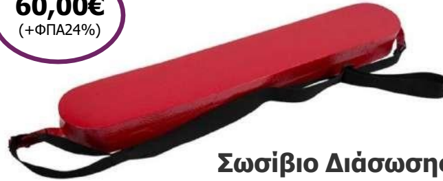
Σωσίβιο Διάσωσης "RESCUE TUBE"