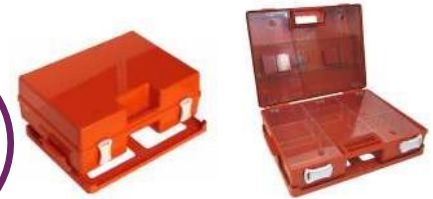
Πλαστικό Κουτί Α' Βοηθειών "Pharma Box"