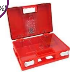
Πλαστικό Κουτί Α' Βοηθειών "Pharma Mini Box" Διαστάσεις: 28 x 20 x 11cm