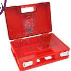
Πλαστικό Κουτί Α' Βοθηθιών "Pharma Mini Box" Διαστάσεις: 28 x 20 x 11cm