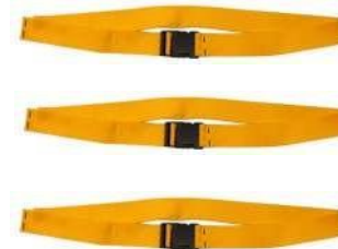
Ιμάντας Πρόσδεσης Μονός Απαιτούνται 3 τεμάχια