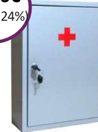
Μεταλλικό Κουτί Α' Βοθηθιών "Pharma Metal Box 2" Διαστάσεις: 40 x 30 x 12cm