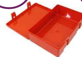
Πλαστικό Κουτί Α' Βοθηθιών "Pharma Universal Box" Διαστάσεις: 25,5 x 17 x 7cm