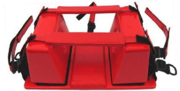
Ακίνητοποιητής Κεφαλής Πολλαπλών χρήσεων "HEAD IMMOBILIZER"