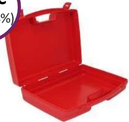
Πλαστικό Κουτί Α' Βοθηθιών "Pharma Flex Mini Box" Διαστάσεις: 32 x 28 x 11,9 cm