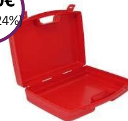
Πλαστικό Κουτί Α' Βοηθειών "Pharma Flex Mini Box" Διαστάσεις: 32 x 28 x 11,9 cm