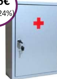
Μεταλλικό Κουτί Α' Βοηθειών "Pharma Metal Box 2" Διαστάσεις: 40 x 30 x 12cm