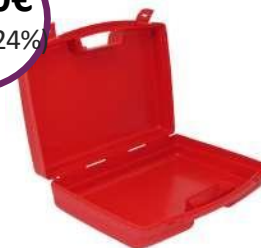
Πλαστικό Κουτί Α' Βοηθειών "Pharma Flex Mini Box" Διαστάσεις: 32 x 28 x 11,9 cm