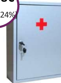
Μεταλλικό Κουτί Α' Βοηθειών "Pharma Metal Box 2 Διαστάσεις: 40 x 30 x 12cm