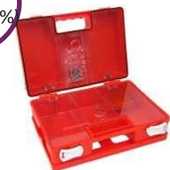
Πλαστικό Κουτί Α' Βοηθειών "Pharma Mini Box" Διαστάσεις: 28 x 20 x 11cm