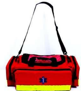
Τσάντα "Pharma Bag 6» + περιεχόμενο